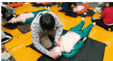
応急救護による心肺蘇生法教習