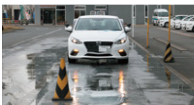
ABS装着車による急ブレーキ体験教習！