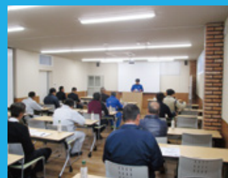
運行管理者基礎講習